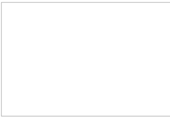
Piste cyclable le long du Bd Westinghouse

Environ 1100 m de pistes cyclables temporaires vont être aménagées d'ici mi-juin dans la ville, avec le Département, pour une pratique sécurisée du vélo. Les cyclistes pourront ainsi rejoindre sereinement le boulevard Westinghouse, depuis l'avenue Kennedy déjà pourvue de pistes cyclables, en passant par l'avenue de Villenaut et l'allée des peupliers, et poursuivre jusqu'à Livry-Gargan. Lignes jaunes et potelets souples vont donc fleurir à Sevran. Proposer une alternative aux transports en commun et à l'usage de la voiture est une nécessité pour la Ville, tant pour des raisons sanitaires qu'environnementales. La crise sanitaire a accéléré le processus. L'objectif est de relier les villes du territoire, les centres hospitaliers, ainsi que le canal de l'Ourcq pour se rendre à Paris en toute sécurité. « En septembre, un bilan sera mené en concertation par le Département et la Ville pour évaluer l'efficacité du dispositif et décider de sa pérennité », indique Ronan Philippot, chargé de mission mobilités et accessibilité à la Ville.