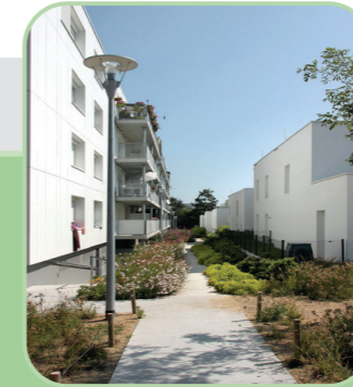
Logements maisons et immeubles