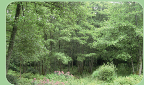
Zone naturelle et préservée