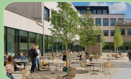
Rez-de-chaussée actifs (commerces, services, associations)