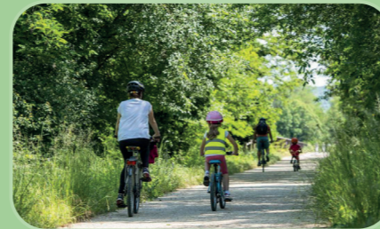
Parc urbain de 18 hectares