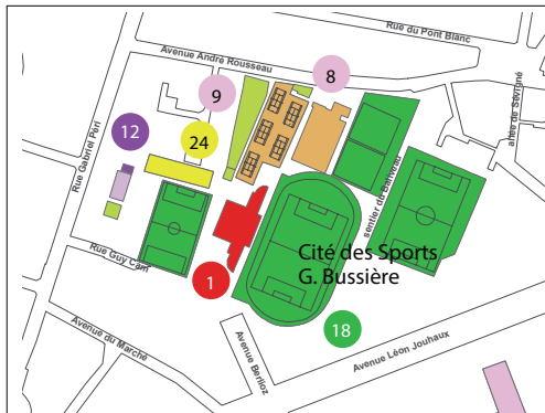
Zoom Cité des Sports Gaston-Bussière